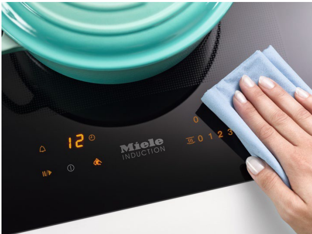
Photo 2 : Avec la protection essuyage, les touches sensibles de la surface de cuisson peuvent être bloquées pendant 20 secondes, ce qui laisse suffisamment de temps pour nettoyer les résidus alimentaires de la surface de cuisson.