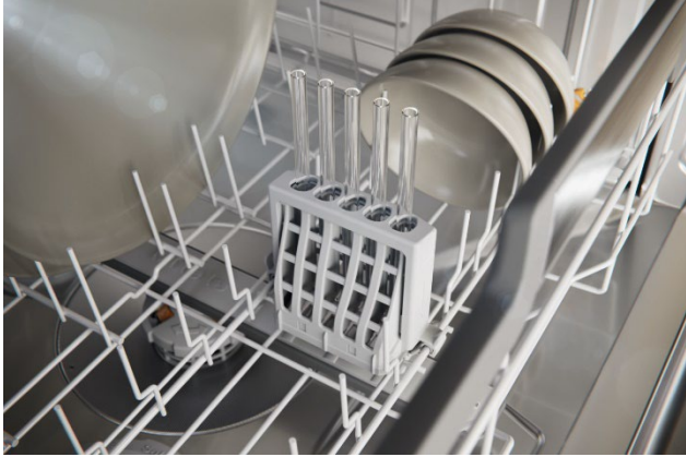
Photo 4 : L'accessoire StrawClean peut être ajouté au panier inférieur redessiné, garantissant un nettoyage efficace des pailles réutilisables grâce à une circulation de l'eau ciblée et précise.