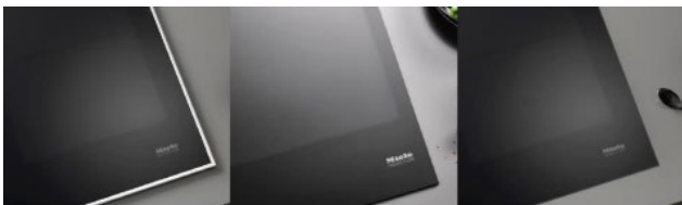
Photo 3 : Les surfaces de cuisson à induction KM7000 de Miele sont disponibles avec ou sans cadre en inox. Les modèles avec cadre sont désignés avec le sigle FR, et les modèles sans cadre, désignés avec le sigle FL, peuvent être installés à fleur de plan ou en saillie.