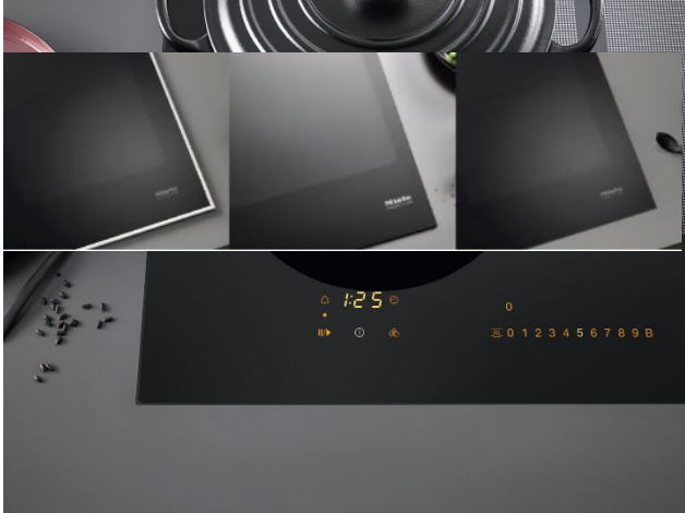
Photo 1 : Les commandes SmartSelect offrent une utilisation rapide et intuitive, permettant de sélectionner directement les niveaux de puissance et les durées pour chaque zone de cuisson.