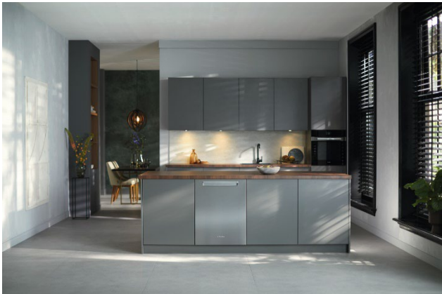
Photo 6: Les nouveaux lave-vaisselle à poignée dissimulée de Miele se caractérisent par une ingénierie supérieure, offrant plus d'espace, plus de commodité et une consommation d'énergie plus faible.